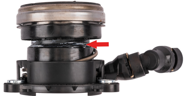
Bild 4: Austritt der Dichtung am CSC, entstanden durch ein zugesetztes Anschlußstück