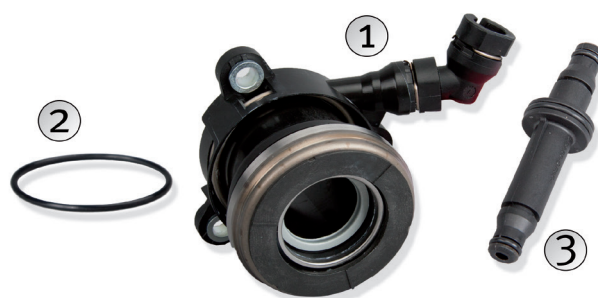
Bild 2: LuK CSC 510 0073 10

Bild 2: Nach Erneuerung des Dichtrings (2) den neuen Zentralausrücker (1) zunächst handfest montieren. Die Schrauben gleichmäßig eindrehen, damit sich der Zylinder nicht verkantet! Anschließend durch die Getriebegehäuseöffnung den Adapter (3) in den Zentralausrücker stecken. Dieser sitzt erst dann korrekt, wenn er hörbar einrastet. Die 3 Befestigungsschrauben des CSC mit 10 (+1) Nm festziehen. Nach dem Einbau des Getriebes ist das Anschlußstück der fahrzeugseitigen Hydraulikleitung (Bild 3) auf dem offenen Rohrende des CSC-Adapters zu montieren. Es muss dabei hörbar einrasten!