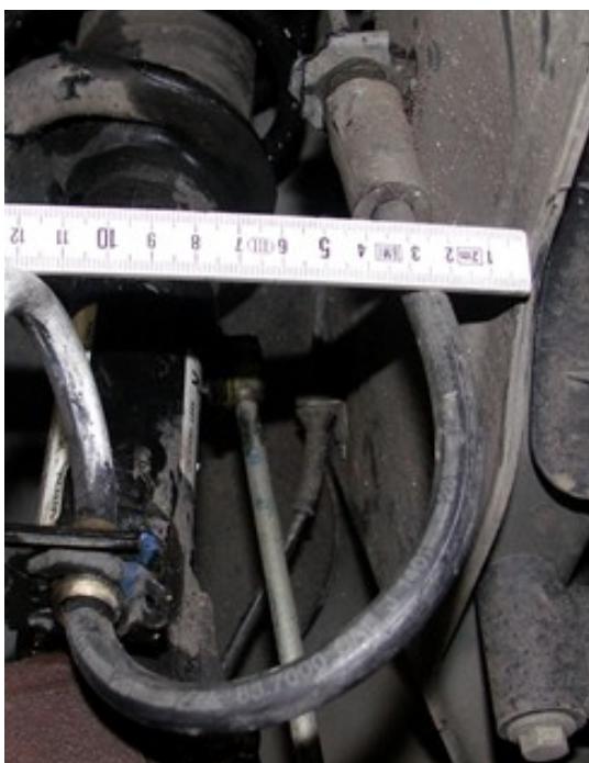
Abb.3: Abstand zwischen Bremsschlauch & Spritzwand