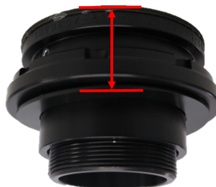
Abb. 4: Einstellmaß HA