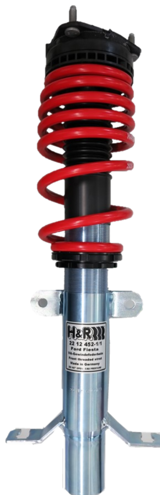
Abb. 2: VA zusammgebauter Zustand