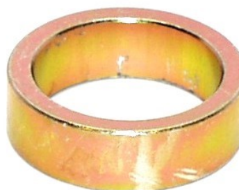
Abb. 2 - Distanzhülse / Fig. 2 - spacer sleeve