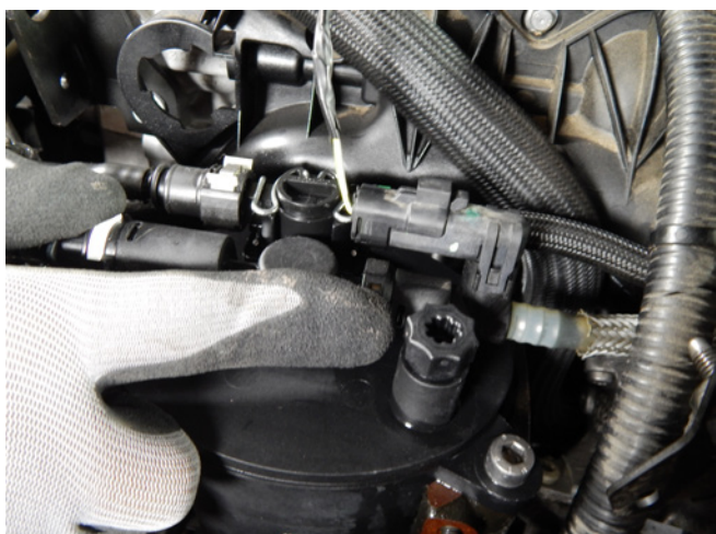
Abbildung 3 Entlüftungsschraube

Diese Filterkonstruktion ermöglicht das Ablassen des Wassers von der Oberseite des Filters, da sich an der Seite des Filters ein Abflussrohr aus Kunststoff befindet. Der schwere Dieselmotorkraftstoff drückt beim Öffnen der Entlüftungsschraube das leichtere Wasser in das Abflussrohr und aus dem Filter.