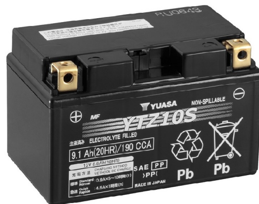
For Illustration Purposes Only